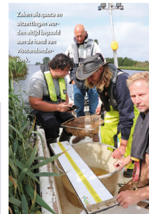
Zaken als quota en uitzettingen worden altijd bepaald aan de hand van visstandonderzoek.

wordt het alweer een ander verhaal. Zo versterk je elkaar en geloof me, dat is echt nodig te komende jaren.”