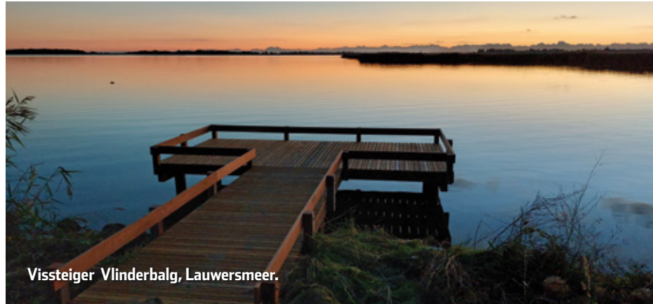
Vissteiger Vlinderbalg, Lauwersmeer.

De Commissie Sportvisserijvoorzieningen van Sportvisserij Fryslân houdt zich dagelijks bezig met het verbeteren van de sportvisserijmogelijkheden in de provincie. Regelmatig worden er visplaatsen en vissteigers aangelegd. Daarnaast wordt er al aan de 14 e VISparel in Fryslân gewerkt.