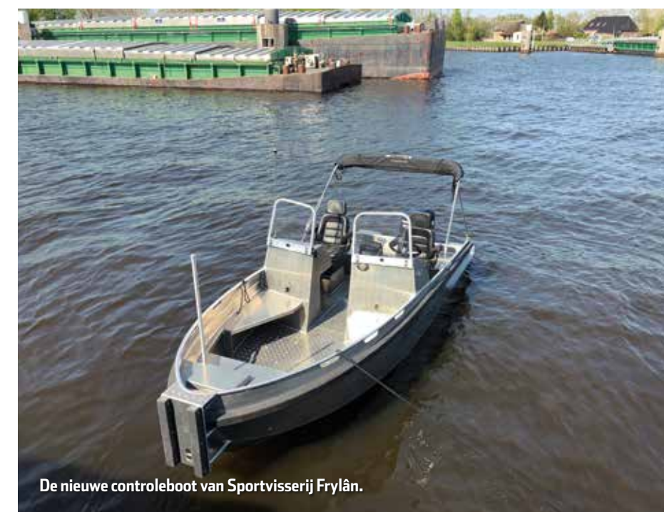
De nieuwe controleboot van Sportvisserij Fryslân.

Om controle op het water verder handen en voeten te geven is een nieuwe controleboot (Bullit 540) in aanbouw. Dit type boot is zeer geschikt voor onze handhavende/toezicht houdende taken. Als de gloednieuwe controleboot in mei in de vaart wordt genomen, wordt de huidige controleboot opgeknapt en aangepast. Met een minder zware motor kan deze boot door alle controleurs (ook die zonder vaarbewijs) worden gebruikt. Het is de bedoeling dat deze tweede boot met de trailer naar diverse locaties in de gehele provincie wordt gebracht om vanuit daar de nabijgelegen visgronden te controleren. We zijn dit jaar dus een stuk mobieler en flexibeler op het water.