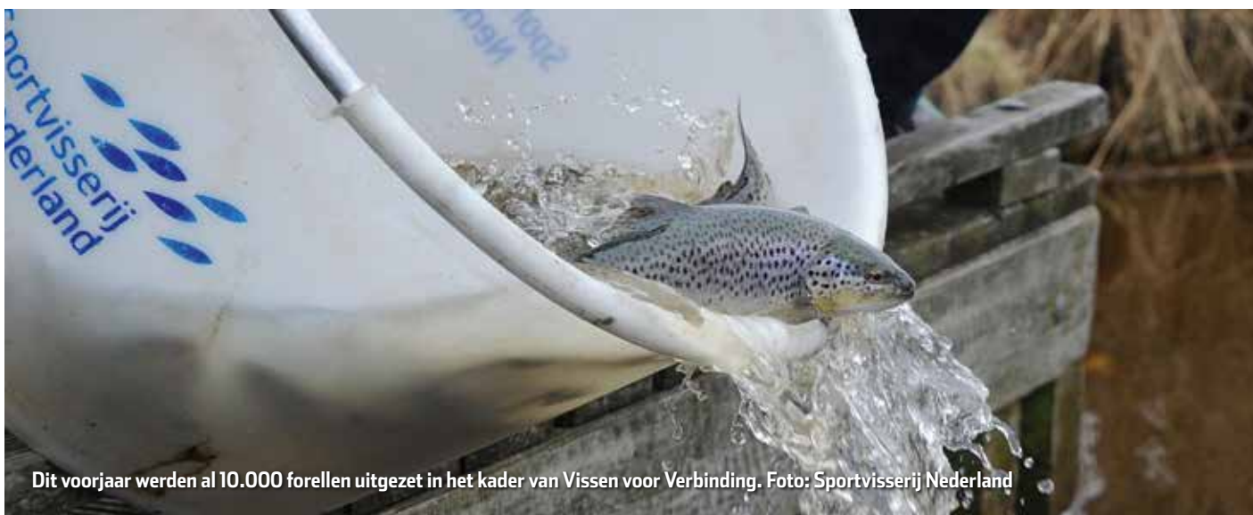
Dit voorjaar werden al 10.000 forellen uitgezet in het kader van Vissen voor Verbinding.