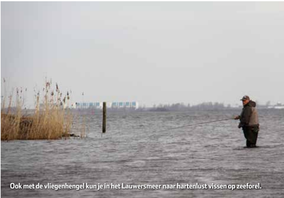
Ook met de vlieghengel kun je in het Lauwersmeer naar hartenlust vissen op zeeforel.

Waddenzee te herstellen. Hier worden bepaalde trekvissoorten geboren. Door de verbinding met de Waddenzee te verbeteren en het leefgebied te herstellen werken we aan de terugkeer van de Atlantische forel." Van alle trekvissen is de Atlantische forel het meest veeleisend. Als we de omstandigheden voor deze vis weten te verbeteren, zullen andere soorten zoals winde, houting en paling vanzelf volgen. Dat zorgt voor een algehele versterking van de visstand in de Waddenzee. En daar profiteren bijvoorbeeld de lepelaars, snoekbaarzen, zeehonden en otters weer van. Zo helpen we niet één enkele soort, maar een heel ecosysteem.