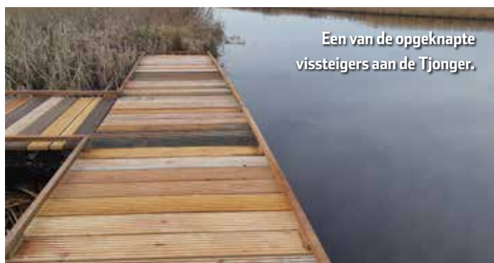
Een van de opgeknapte vissteigers aan de Tjonger.

Aan de Tjonger nabij Ter Idzard liggen in een prachtige omgeving drie vissteigers. Zo kan hier ondanks de natuurvriendelijke oevers toch