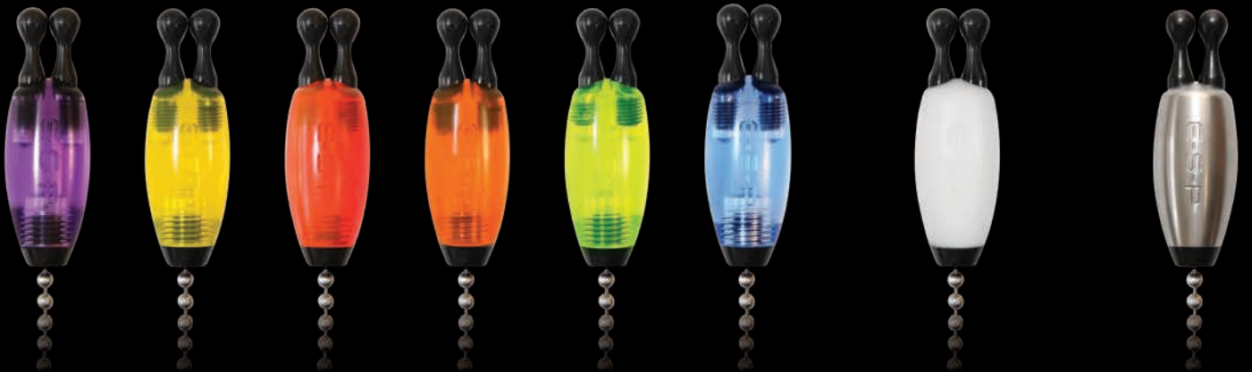
SIX ACRYLIC COLOURS (3g 6g 9g COMBO)

E-S-P ISOTOPES ARE ENCASED IN CLEAR PLASTIC SLEEVE TO PROTECT THEM FROM DAMAGE AND TO PROVIDE A SNUG INTERFERENCE FIT INTO THE BOBBIN SLOT.