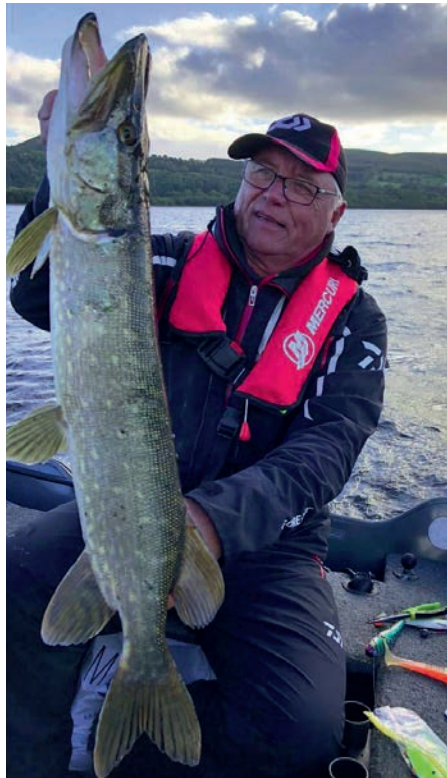
In Ierland is een zwemvest verplicht

Ook binnen onze vereniging was er kortgeleden een dergelijk akkefietje, gelukkig met goede afloop, maar dat had ook heel anders kunnen aflopen. Met de winter voor de deur is het wellicht verstandig om toch nog even stil te staan bij een aantal zaken omtrent de veiligheid waar op voorhand rekening mee gehouden kan worden. Het is niet voor niks dat er wettelijke veiligheidsvoorschriften zijn opgesteld voor zgn. "snelle motorboten". Vanzelfsprekend gelden die niet voor met minder PK's uitgeruste visbootjes, maar als je regelmatig wat groter water opzoekt, of wateren waar ook regelmatig grote schepen varen is het wellicht verstandig om in ieder geval een zwemvest te dragen en niet alleen als je niet goed kunt zwemmen. Als het water straks echt een stuk kouder wordt heb je niet zoveel tijd om naar de kant te zwemmen voor je onderkoeld raakt. Bovendien heb je dan vaak veel meer kleren aan en die zitten tijdens het zwemmen vooral in de weg. Uitdoen onder water is geen optie. In landen als Noorwegen, maar ook in Ierland is het dragen van een zwemvest altijd verplicht