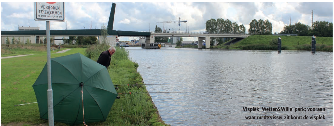
Visplek 'Wetter&Wille' park; vooraan waar nu de visser zit komt de visplek

Via deze onlineservice van Sportvisserij Nederland kun je ook zelf adreswijzigingen doorgeven, duplicaat VISpas of meeVistoestemming aanvragen. Verder kun je hier de papieren lijst van viswateren (de-)activeren als je die weer wilt ontvangen in plaats van gebruik te maken van de VISplanner. Om gebruik te kunnen maken van MijnSportvisserij, moet je je eerst registreren op www.mijnsportvisserij.nl