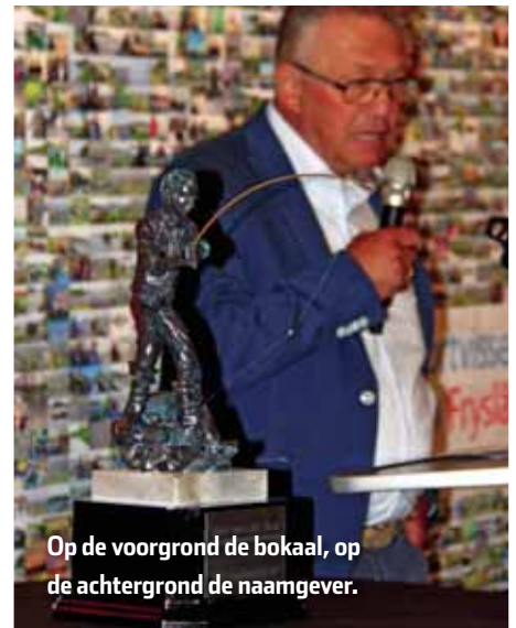
Op de voorgrond de bokaal, op de achtergrond de naamgever.

De Sake vd Meer Wisselbokaal is een blijvende herinnering aan de voorzitter die Sportvisserij Fryslân zeer succesvol geleid heeft tijdens een bloeiende