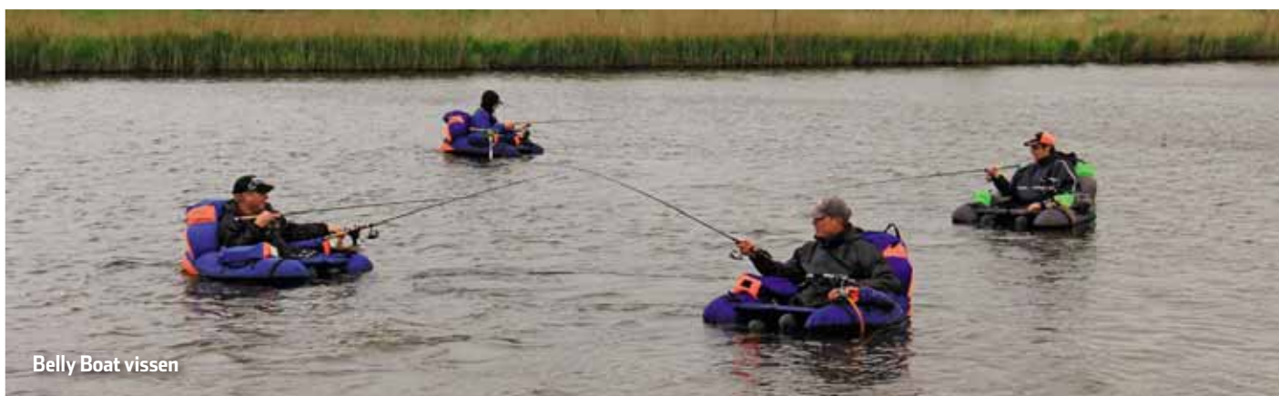
Belly Boat vissen

Meer informatie. Gewoon even vragen bij De Visvrind of door te bellen met Tiemo Koopman (06-53725821).