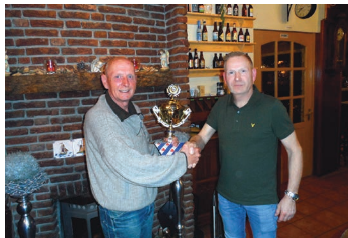
Johan feliciteert verschillende 'kanjers'.