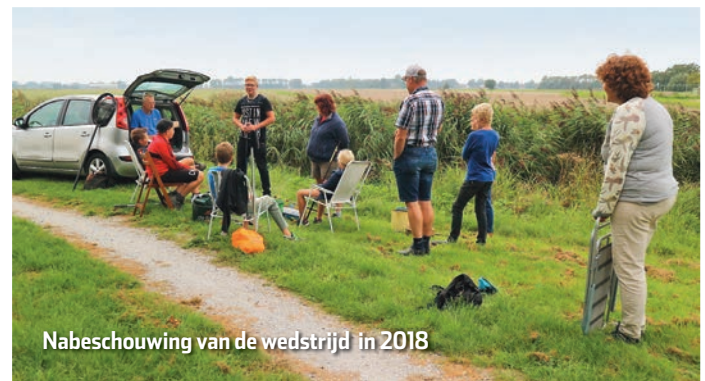
Nabeschouwing van de wedstrijd in 2018

De jaarlijkse "Lytse Fisker" viscompetitie van De Deinende Dobber gaat weer van start. Op woensdag 22 mei starten de viswedstrijden voor de jeugd. Het is een competitie over 6 wedstrijden. We vissen in het Berlikumer wijd op de vissteigers van de vereniging. Wie de meeste vissen vangt is winnaar en krijgt 1 punt. De nummer 2 krijgt 2 punten enz. Wie na 6 wedstrijden de minste punten heeft wordt kampioen. Kinderen die niet elke keer mee kunnen doen mogen ook mee vissen. Deelnemers kunnen zich opgeven op de website van 'de Deinende Dobber'. Hier worden ook de overige data bekend gemaakt.