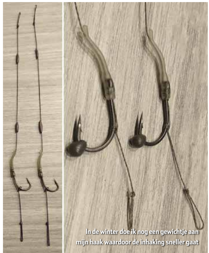
In de winter doe ik nog een gewichtje aan mijn haak waardoor de inhaking sneller gaat

Eigenlijk is het gekkenwerk maar ik laat mij niet weerhouden door het slechte weer en stap vol goede moed in mijn boot. Met een koude noordoosten wind in mijn gezicht en ongekend veel natte sneeuw om de oren zet ik mijn koers richting de stek. Na een uur varen kom ik aan en kijk op de klok. Het is al 21 uur en leg mijn boot vast aan de steekstokken. Ik heb geen haast dus gun mij zelf eerst een warme bak thee en kijk naar boven. Het wordt een heldere nacht met volle maan, dit belooft nog wat. Het zal niet de eerste nacht zijn dat ik met volle maan een dikke vis vang. Met gepaste spanning trek ik mijn zwemvest aan en vaar mijn montage richting de aangevoerde stek. Bij het neerleggen van mijn rig word ik opgeschrikt door een uil. Wat zijn ze prachtig om te zien en ik kom ze steeds vaker tegen rond de stad Leeuwarden. Ik kijk naar mijn hengeltoppen die ik door de heldere maan kan zien. Op dat moment zie ik een tik op de top en voorzichtig komt er geluid uit mijn beetmelder. Binnen een paar seconden sta ik met een kromme hengel en niet veel later schuift er een prachtige spiegel in mijn landingsnet. Het is een kleine rakker