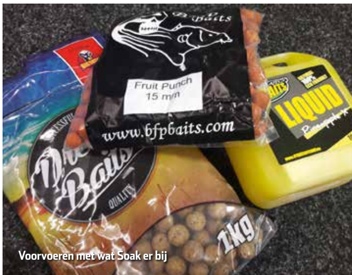
Voorvoeren met wat Soak er bij

maar zeer welkom. Wat een plaatje is het en ik zet haar weer terug in het water waar ze hoort. De nacht verloopt snel en weet nog meerdere karpers te vangen. Tegen het ochtendlicht word ik mijn bed uit gerammeld door een gierende slip van de molen en het geluid van de beetmelder is ongekend hard. Ik pak de hengel op en voel meteen dat het om een grote vis gaat. Hoofd koel houden en zorgen dat ze in de boot komt. Ze weet meerdere keren de obstakels rond de stek op te zoeken maar uiteindelijk verliest ze de strijd. Na enkele prachtige foto's te hebben geschoten, haast ik mij richting huis. Onderweg geniet ik nog na van deze heerlijke winternacht.