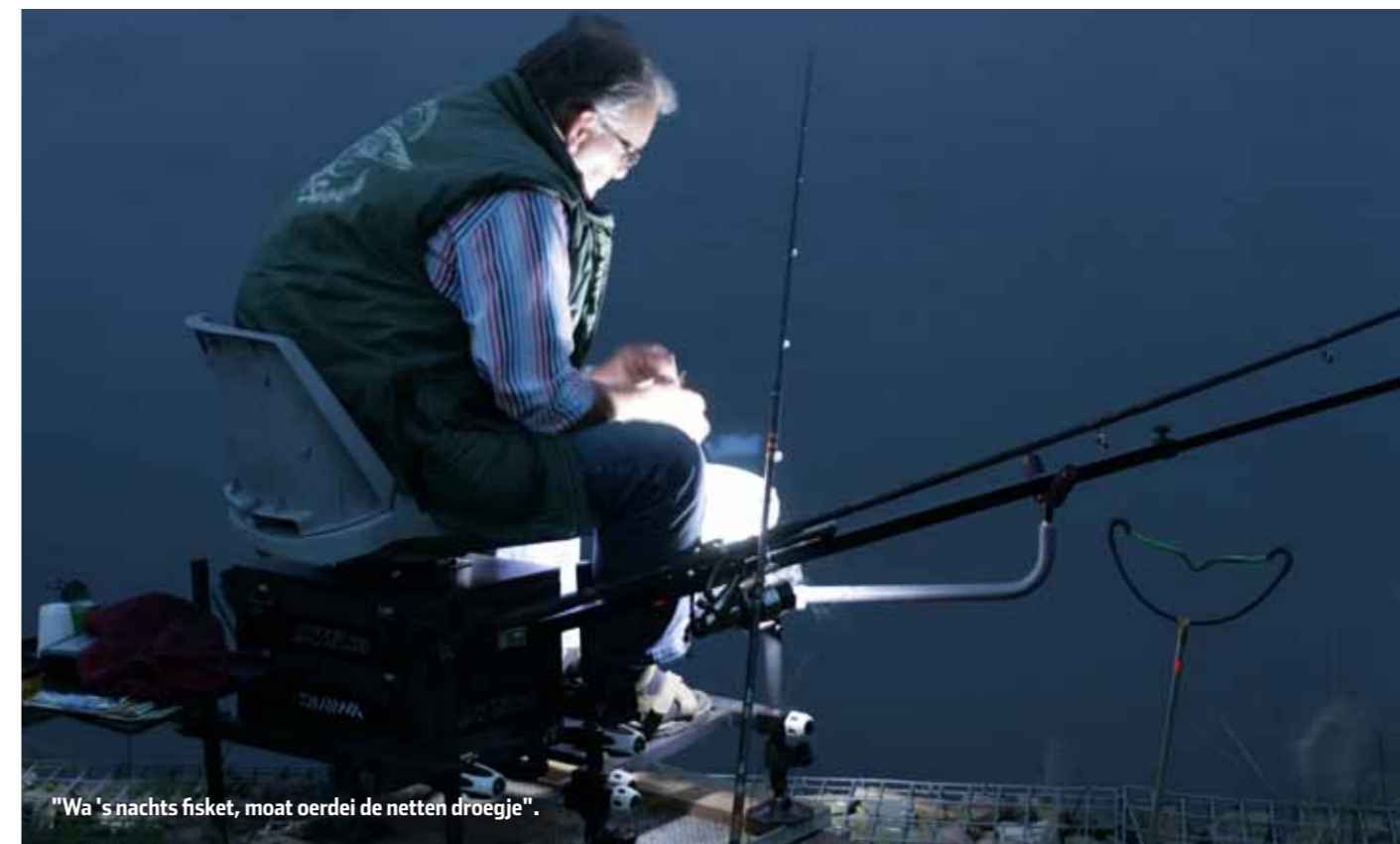
"Wa 's nachts fisket, moet oerdei de netten droegje".

De volgende data en locaties zijn vastgesteld