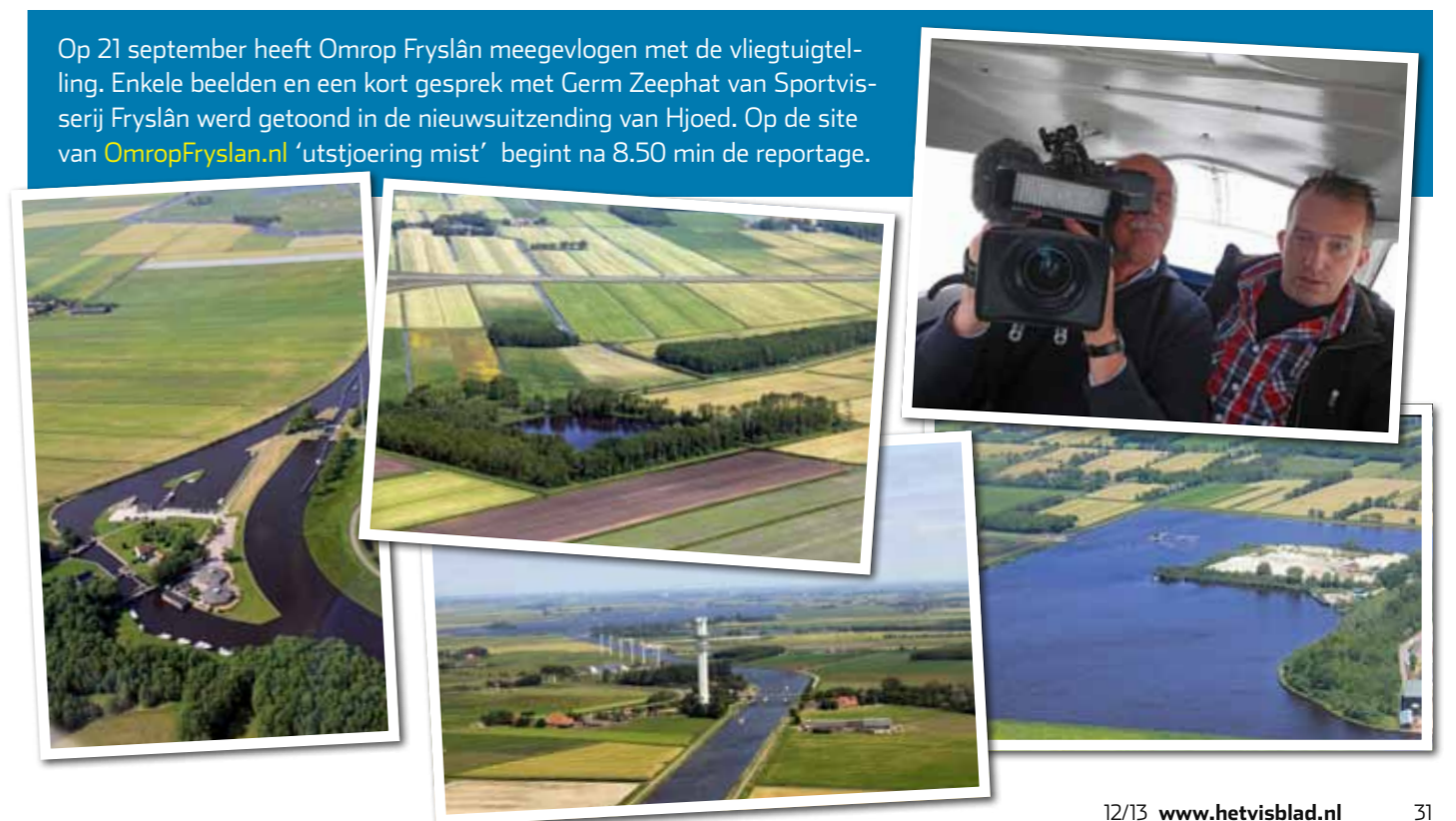
Op 21 september heeft Omrop Fryslân meegevlogen met de vliegtuigtelling. Enkele beelden en een kort gesprek met Germ Zeephat van Sportvisserij Fryslân werd getoond in de nieuwsuitzending van Hjoed. Op de site van OmropFryslan.nl 'utstjoering mist' begint na 8.50 min de reportage.

Om de vraag te beantwoorden hoeveel sportvisserij jaarlijks de Friese boezem bezoeken worden tellingen gedaan vanuit de lucht. Sinds december 2012 worden er vanuit kleine sportvliegtuigen (4 persoons Cessna) tellingen gedaan. Gestreefd wordt om twee maal per maand te vliegen, maar door slechte weersomstandigheden is dit niet altijd mogelijk. Er is inmiddels 14 keer gevlogen, waarbij in totaal 1.400 sportvisserij zijn waargenomen. Ongeveer de helft van de waargenomen sportvisserij vertegenwoordigen een klein deel van het totale aantal vissers dat jaarlijks de Friese Boezemwateren bezoekt. Met behulp van landelijke gegevens kunnen de waarnemingen worden omgerekend naar het totale jaarbezoek. Het is nog te vroeg om nu al een schatting te geven van het totale jaarbezoek.